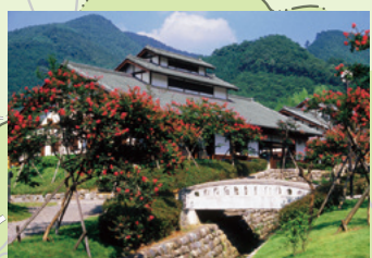
小平の里狸穴亭 (サルスベリ)

関東ふれあいの道(首都圏自然歩道)コース32 紅葉映える峡谷のみち (全長14.5km) 上神梅駅～大間々駅